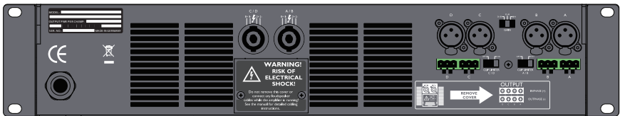
Q-Power 10 背面パネル