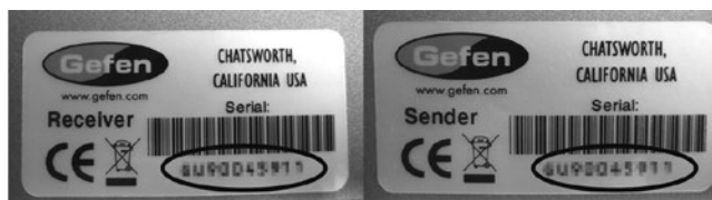
シリアルナンバー表示例

本製品には、送信機と受信機に同一のシリアルナンバーが割り振られております。万が一、不具合が発生し修理の依頼などを行う際には、本体裏面に記載されているシリアルナンバーをご確認いただき、シリアルナンバーを揃えた状態で、送信機と受信機の両方をご発送いただきますようお願いいたします。